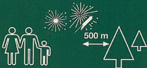
Castells de foc