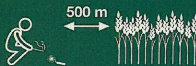
Coets i petards a prop de camps de cereals